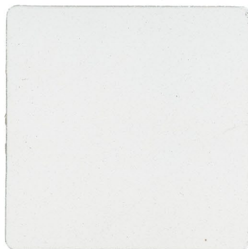
RASANTE IN PASTA

Producto en polvo a base de cal y conglomerante hidráulico formulado con aditivos especiales. Puede utilizarse en numerosas aplicación; por ejemplo: alisado de enlucidos viejos o superficies varias previamente tratadas, restauración de acabado "con fines civiles" antes de proceder a ciclos de pintura de todo tipo, encolado de paneles y alisado en el ciclo de aislamiento térmico "por techo", o alisados armados con red de fibra de vidrio para la restauración de enlucidos con cuarteados y grietas. Aplicación: aplicación con talocha de acero inoxidable - acabado con talocha de plástico o talocha pequeña de espuma Ficha técnica: D-29 Rendimiento teórico: 1,3 kg/m 2 por mm de grosor Colores disponibles: blanco, gris