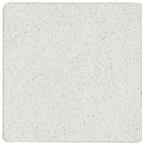
RASANTE MINERALE FRATAZZABILE

Fondo riempitivo pigmentato a base minerale per la preparazione dei supporti nei sistemi a base di Silicati, Calce e Silossanici. E' particolarmente indicato per il trattamento di fondi con diversa di assorbimento dovute a rappezzi con malte idonee o lievi discontinuità strutturali. Fondo di collegamento per l'applicazione di prodotti minerali su tutti i supporti, anche se precedentemente trattati con finiture sintetiche ben ancorate. Applicazione a pennello e rullo Granulometria: 0,2 mm Scheda Tecnica: D-06 Resa teorica: 4 - 7 mq/litro in funzione dell'assorbimento del supporto Colori disponibili: bianco