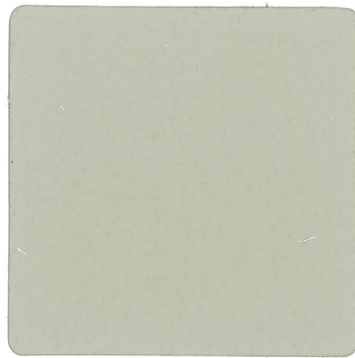
FONDO DI PREPARAZIONE UNIVERSALE

Rete in fibra di vetro apprettata, alcaliresistente, utilizzabile per l'armatura dei prodotti di rasatura in polvere e in pasta. Idonea per il ciclo di isolamento termico "a cappotto". Peso : 150 g/mq Scheda Tecnica: O-05 Dimensione reticolo : 4 x 4 mm Dimensioni: rotoll da 50 ml x 1 m