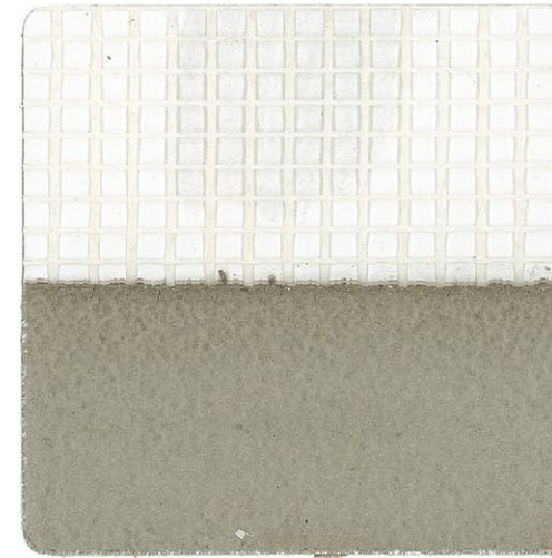
RETE IN FIBRA DI VETRO

Red de fibra de vidrio con apresto, resistente a los álcalis. Puede utilizarse como armazón de productos de alisado en polvo y en pasta. Ideal para el ciclo de aislamiento térmico "por techo". Peso : 150 g/m 2 Ficha técnica: O-05 Medidas retícula: 4 x 4 mm Presentación: rollos de 50 mm x 1 m